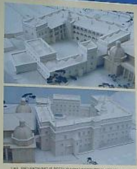
LIETUVOS PARLAMENTO IR SEIMALYKŲ PASTATŲ SAVAITĖS 2009 M.

LIETUVOS VALDOVŲ RŪMAI Vilniaus žemutinės pilies Lietuvoje valdovų rūmai buvo Lietuvos politinis, administracinis ir kultūrinis centras. Čia iki šiol seniausis mūrai Lietuvoje, datuoti su valstybės pradžia XIII a. Valdovų rūmuose buvo sukaupta Europoje garsėjusi biblioteka, meno rinkiniai, brangenybų lobynas. Čia XVII a. pirmą kartą talpa istorijoje atliko operą. Rūmai bus atkurti iki 2009 m. - Lietuvos vardo penkimojo šimtmečio jubilėjus, jie veiks kaip valstybės reprezentacijos, jos istorijos, kultūros ir švietimo centras. Kviečiame ir jus pasirod šio istorinio atkurtimo idėja.